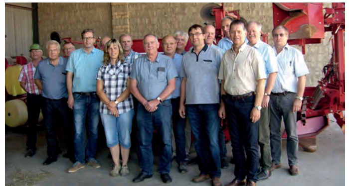
BVS-Delegierte zu Besuch bei der Agrar GmbH Flämingland in Blönsdorf.